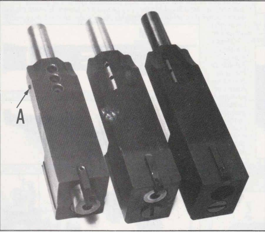
▽ Trois contrepoids «lourds», dont deux sont bricolés. En «A», une petite vis a été placée pour maintenir le canon bien à sa place. Ce fourreau-là est raccourci de 15mm et les trous de décompression ont été percés verticalement. Le modèle du centre est amputé de 5mm. Cela permet un bon poids au pistolet sans l'ennui d'un nez trop tombant. La largeur de ces contrepoids est de 28mm au lieu de 22mm pour le standard.

cheurs stressés ne se consolait guère de ces premiers déboires !