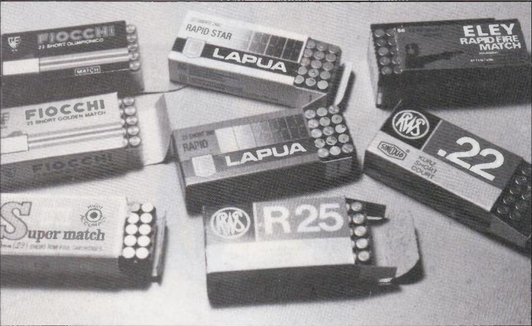
◁ Voici les principales marques de cartouches de match de .22 Court prétendant au mariage avec l'OP601. A l'exception des Vostock Super Match, on les trouve facilement en Europe, et elles assurent toutes un fonctionnement parfait. Un percuteur modifié pour frapper plus largement améliore la fiabilité des Vostock. Comme nous préférons un cabrage de l'arme limité mais plutôt bref qu'encre plus réduit mais trop lent, ce sont les Fiocchi Golden Match que nous préférons utiliser juste avant les Lapua Rapid Star, Vostock et RWS R25.